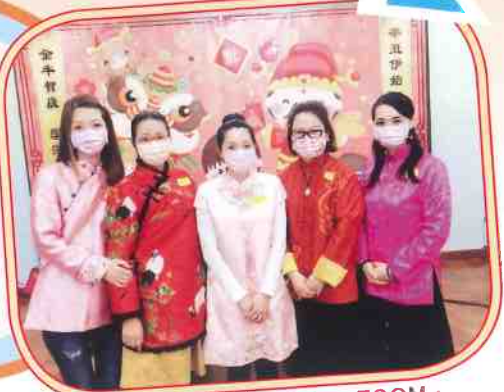
家長執委齊來ZOOM-ZOOM，參與中國文化日網上ZOOM活動

另外，在新常態的學習環境下，家長跟學生一樣多參與非一般的中華文化日線上活動及學習新興的運動一地壺。為讓學生多添歡笑，家長教師會更在不同節慶中為全校師生及家長安排別具心思的小禮品。