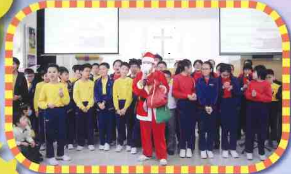
六年級同學到幼稚園進行服務學習

為了讓家長及社區人士了解本校的辦學宗旨及課程特色有深入的了解，本校定期安排對外聯繫活動，與社區的幼稚園保持聯絡，建立良好關係，以往與幼稚園聯繫之活動非常豐富，如六年級學生到幼稚園進行服務學習活動、幼稚園家長及學生到校參與體驗活動、中國文化日活動等等。