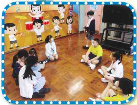
建立團隊精神的遊戲

成長的天空計劃（四年級）於10月開展，並有15名學生參加。計劃希望能提升學生的正面社會聯繫、提高學生效能感、歸屬感及樂觀感，以幫助他們面對成長的挑戰。本學年因為疫情停課的關係，小組活動需要以視像形式進行，亦未能外出的營地挑戰。即使隔著螢光幕，學生仍積極投入活動，實在值得讚賞。期待下學年疫情能有好轉，並與同學們一同到戶外營地，挑戰自我。