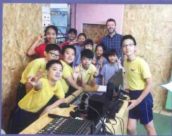
Students are preparing the English morning assembly!

This instructional strategy has been proven to help all levels of readers improve their reading, comprehension and word recognition, to name a few. Timed repeated reading also helps children, teachers and parents identify the areas that the child needs improving, such as vocabulary building, fluency or understanding the main ideas of a text. Try using timed repeated reading the next time you would like to practice reading. Not only will you help improve your reading and understanding, you'll have fun! I guarantee it!