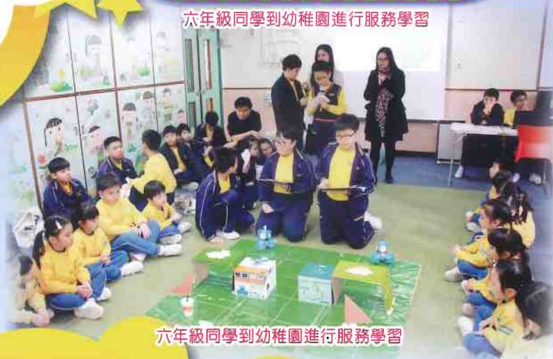
六年級同學到幼稚園進行服務學習