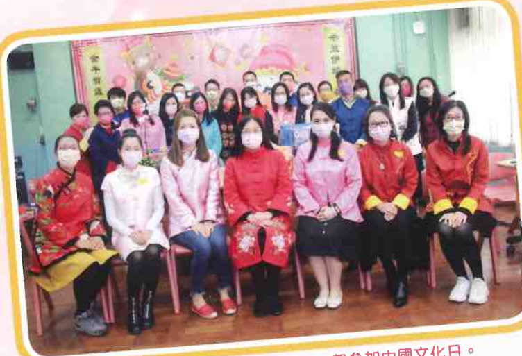
校長、家長和老師都穿上華服，一起參加中國文化日。