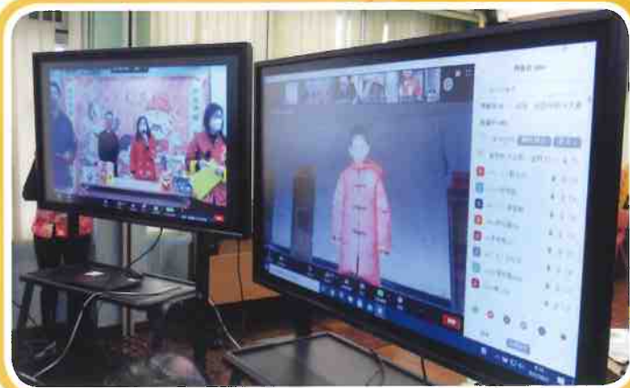
學生穿上漂亮的華服參與中國文化活動日。