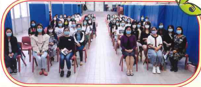
2020年11月4日舉行家長愛心隊聚會