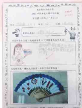
同學們設計的絹扇及紙扇。