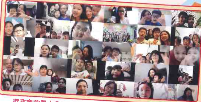
家教會會員大會ZOOM-ZOOM，學生家長齊參與。