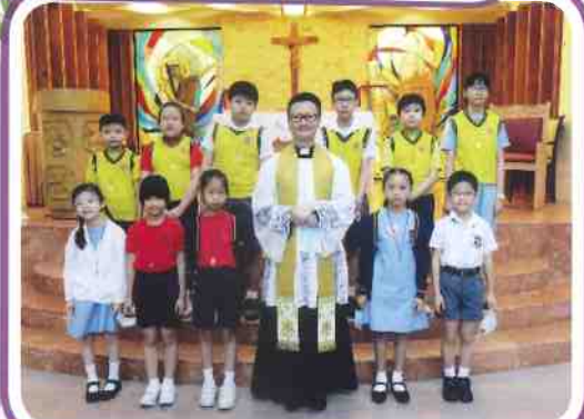
神父與部份小團體成員合照。