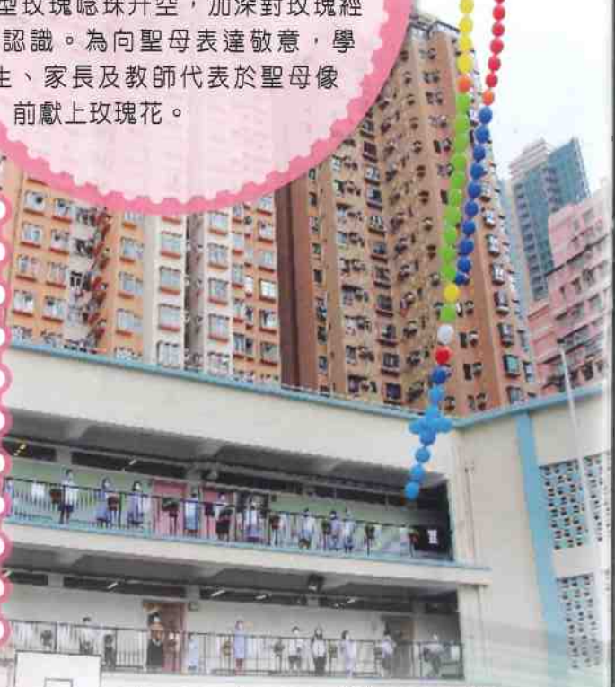
大型充氣玫瑰唸珠升空，師生同為疫情祈禱。