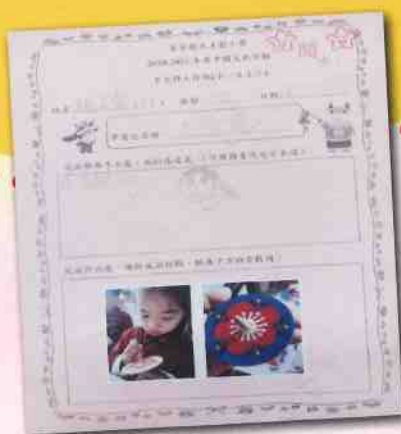
同學用心製作中國民間小玩意。