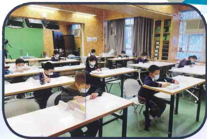
資優教育——四、五年級數學尖子選拔

本校為實踐「全校參與」模式融合教育，以跨專業團隊模式支援不同教育需要的學生，如：駐校言語治療師、外聘職業治療師及教育心理學家；並就課程、教學策略及考試調適等安排作調適，設不同的拔尖補底小組及推薦學生參加校外資優課程，亦推行校本課後學習及支援計劃，照顧不同需要的學生。