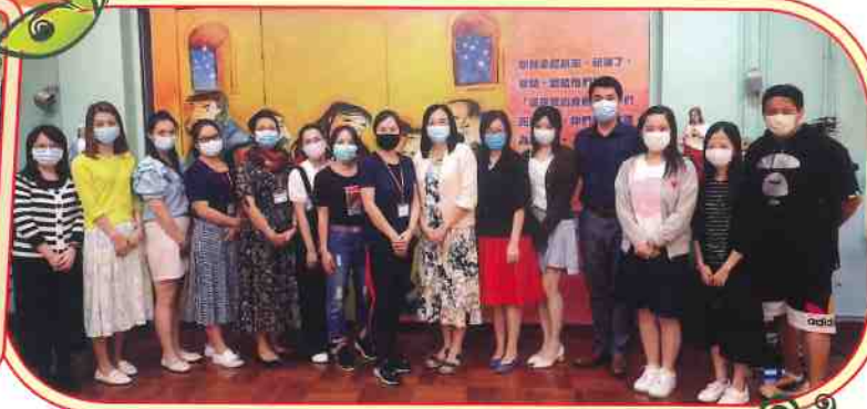
家長教師會執委為發展會務共商良策