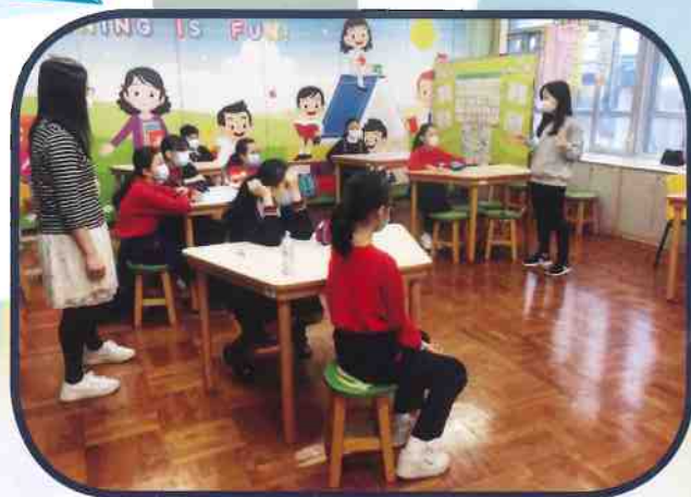
資優教育——藝術教育活動