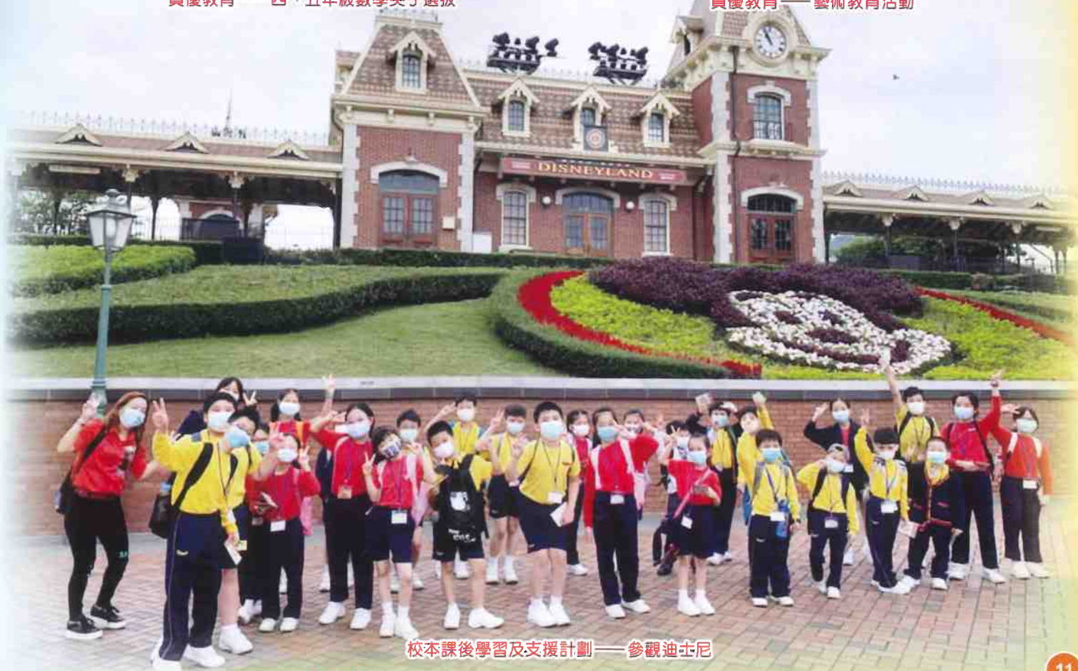
校本課後學習及支援計劃——參觀迪士尼