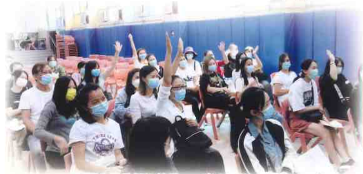
家長也要做個好榜樣——專心聆聽，主動回答問題