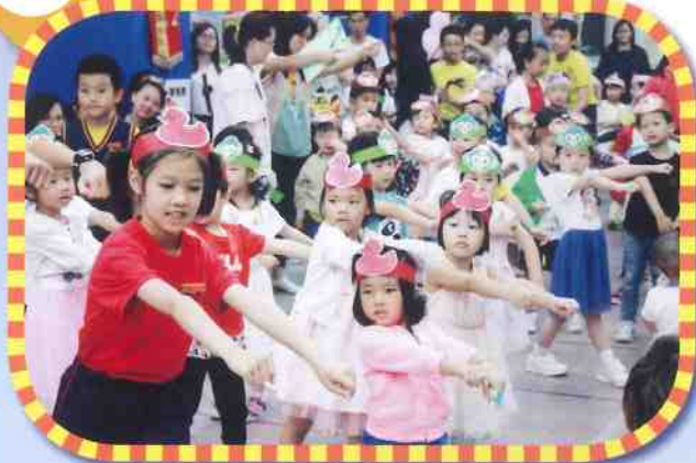
幼稚園學生到校參與活動