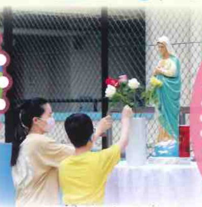
各代表獻花於聖母像前。