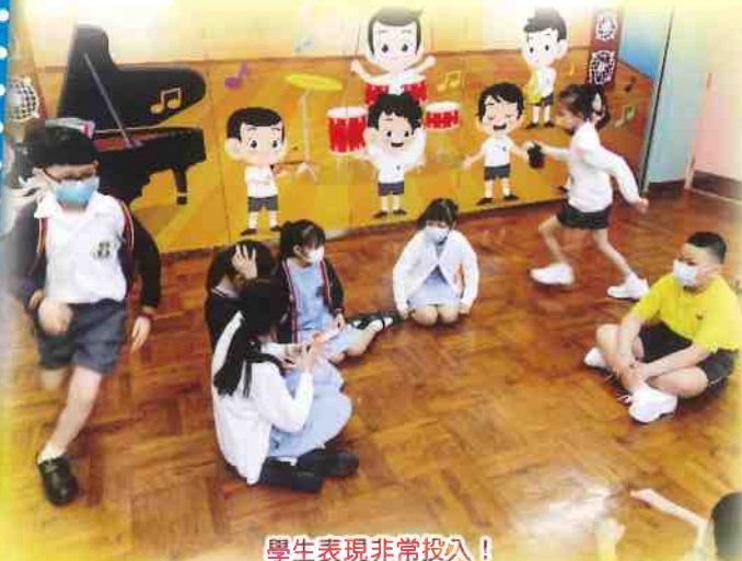
學生表現非常投入！