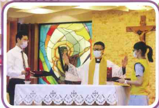
神父祝福送給小團體成員的聖牌。