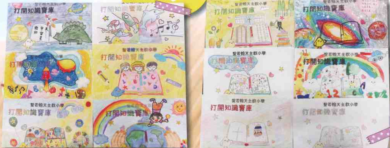
幼稚園家長及學生參加本校舉辦親子繪畫比賽之作品

由於疫情關係，本年度舉辦之幼稚園聯繫活動形式有所改變，本校舉辦了「打開閱讀寶庫」幼稚園親子繪畫比賽，邀請了觀塘區幼稚園K2及K3家長及學生參加，是次活動已順利完成，幼稚園家長及學生發揮無限的創意，踴躍參與繪畫比賽。