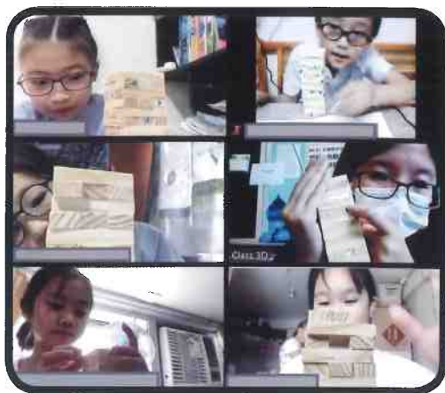
校本課後學習及支援小組——童夢飛翔

本校為實踐「全校參與」模式融合教育，以跨專業團隊模式支援不同教育需要的學生，如：駐校言語治療師、外聘職業治療師及教育心理學家；並就課程、教學策略及考試調適等安排作調適，設不同的拔尖補底小組及推薦學生參加校外資優課程，亦推行校本課後學習及支援計劃，照顧不同需要的學生。