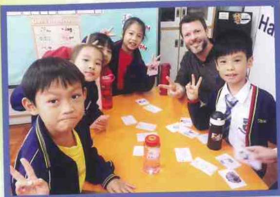
Students are having fun in the English Corner!

I would like to introduce you to an instructional strategy to help improve children's reading fluency (the ability to read with speed, accuracy and expression) and comprehension (understanding). This strategy is known as 'timed repeated reading'. As the name of the strategy suggests, this activity is a timed activity. It uses a timer, or stopwatch, to help monitor a child's reading fluency development. Improving a child's reading fluency assists their reading accuracy (number of correct words), leading to improved comprehension. This strategy should be done with a child and an adult.